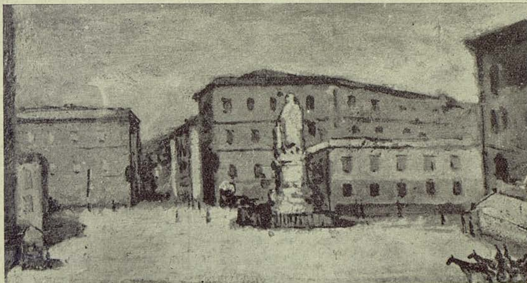
Pittori livornesi: GIOVANNI BARTOLENA « Piazza Cavour »